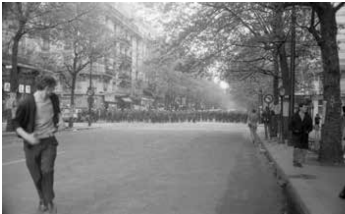
Philippe Gras Maj 68

Fotografier taget af Philippe Gras i Frankrig i løbet af maj 1968, er et vidnesbyrd om en periode, der er lige så meget en myte, som en del af historien. Under de famøse optøjer i Paris var der mange fotografer med i forreste række. Philippe Gras er blandt de fotografer.