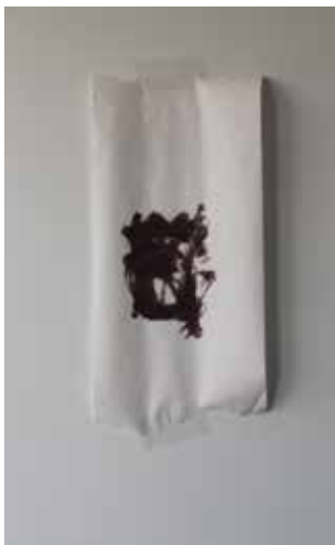
Jonas Greve Handskemager Do not read me, 2018

Tyveri udføres succesfuldt i det usynlige men synliggøres i udstillingsrummet. Myldretid forbinder de rejsende, og på S-tog stationen opleves en delvis synlig dialog, som for andre blot vil være "et landskab i tusmørke" (Tyens Dagbog, 1949).