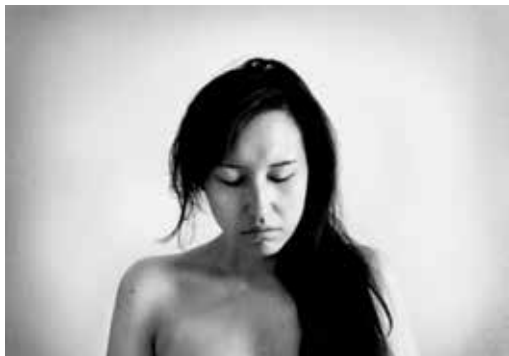
Jukke Rosing Moment of weakness, 2018

Fotograf Jukke Rosing giver os et indblik i en verden fyldt med spørgsmål og uafklaret identitet. Mange af os oplever på et tidspunkt