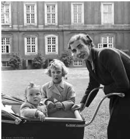
Princess Benedikte, Princess Margrethe and Princess Ingrid, 1945

Den amerikanske fotograf arbejdede som korrespondent for Vogue under 2. verdenskrig. Udstillingen viser de fotos, som optog, da hun i maj 1945 kom til Danmark. During the Second World War, American photographer