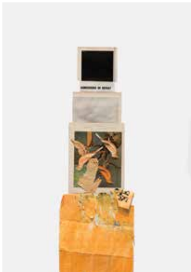
Anohni Anohni, 2017

24. maj åbner Nikolaj Kunsthal udstillingen Miracle Now af den britisk-amerikanske kunstner og musiker ANOHNİ. Værker på papir, malerier og skulpturer bliver ledsaget af en 9-kanals videoinstallation og skrøbelige dokumenter fra ANOHNİs arkiv.