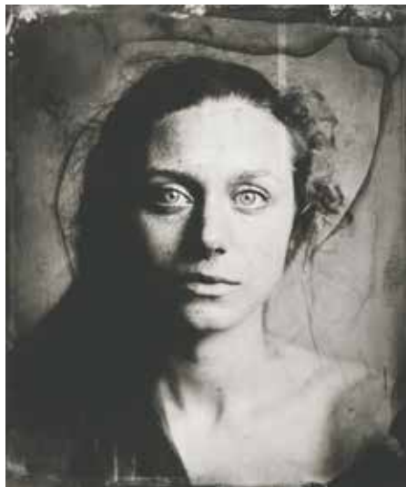
Daniel Samanns Untitled, 2017

Daniel Samanns' ambrotyper udvider vores opfattelse af fotografi. Portræterne er skabt som vådkollodium fotografi og sender os tilbage i tiden for at genopdage et glemt fotografisk håndværk.