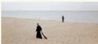
© Ulrik Hasemann og Mathias Svold, Kystland

Udvalgte værker fra Den Censurerede Udstilling sælges til højestbydende sammen med Bruun Rasmussen og Copenhagen Contemporary. Mødested 4