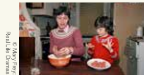
© Mary Frey, Real Life Dramas

Broens Gadekøkken 12. juni 17-18 og Kulturtårnet på Knippelsbro 13. juni 16-18. Begge arrangementer er gratis.