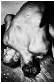
TVILLING | Jacob Aue Sobol

De starter med at kilde hinanden i øret. De kan ikke lade være at røre ved hinanden. Så følger trangen til at gå skridtet videre. Kilden og kys bliver til slag og spark. To mennesker, der omslutter hinanden. – Jacob Aue Sobol