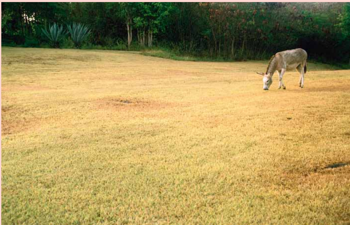
Nanna Debois Buhl, Donkey Studies , 2008.